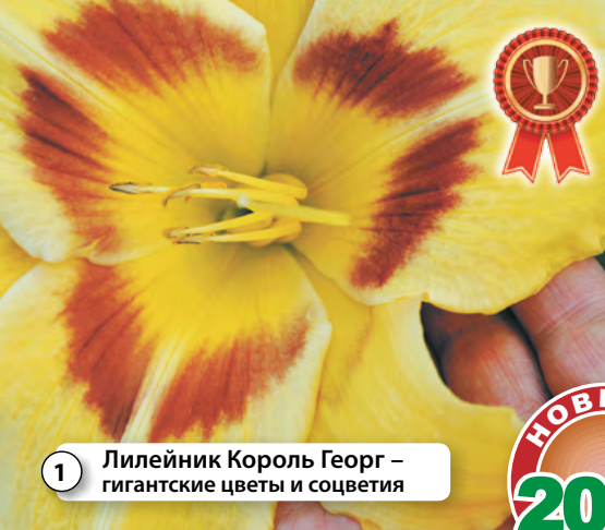
1 Лилейник Король Георг – гигантские цветы и соцветия