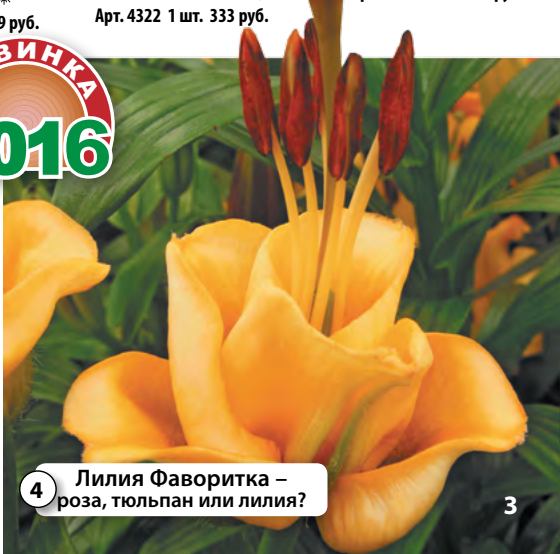
4 Лилия Фаворитка – роза, тюльпан или лилия?