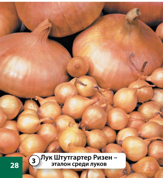
3 Лук Штутгартер Ризен – эталон среди луков