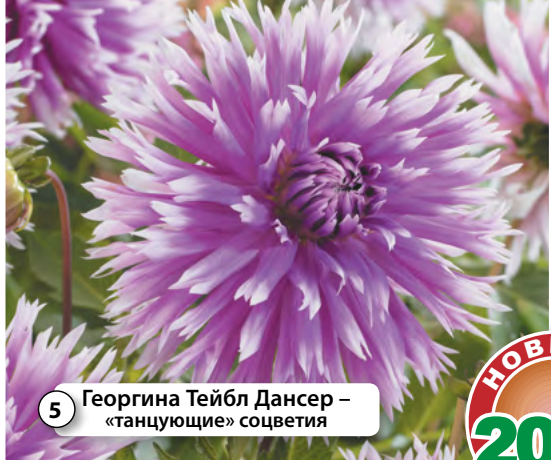
5 Георгина Тейбл Дансер – «танцующие» соцветия