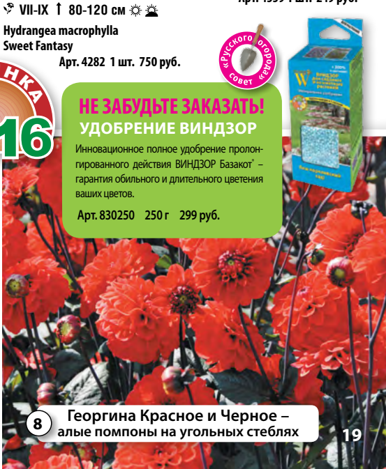
8 Георгина Красное и Черное – алые помпоны на угольных стеблях