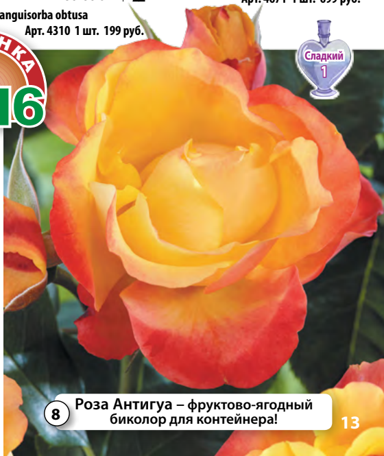
8 Роза Антигуа – фруктово-ягодный биколор для контейнера!