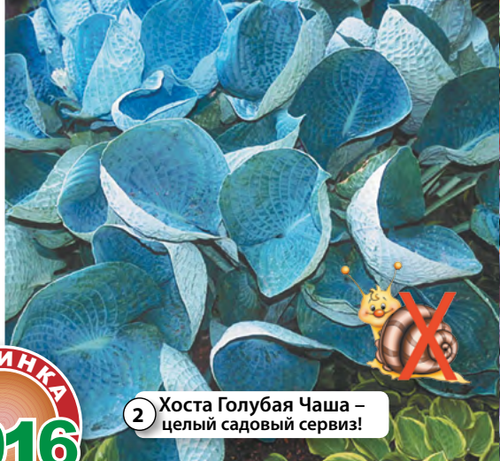
2 Хоста Голубая Чаша – целый садовый сервиз!