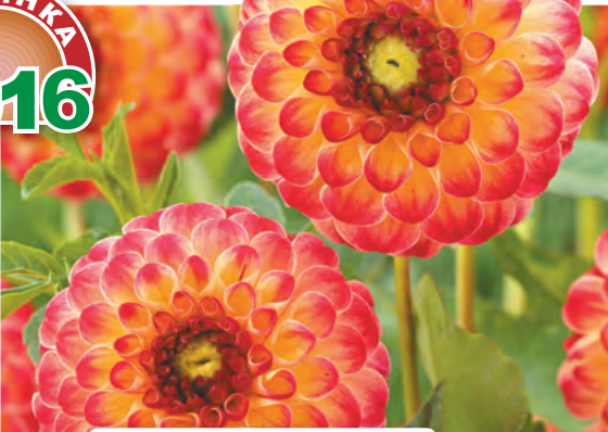
8 Георгина Аламо – дынно-клюквенный десерт