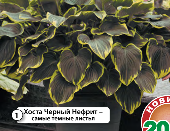
1 Хоста Черный Нефрит – самые темные листья