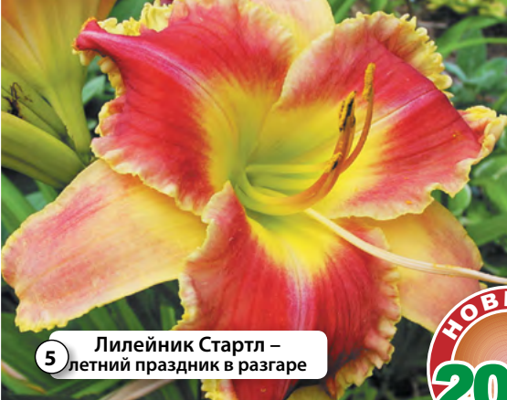
5 Лилейник Стартл – летний праздник в разгаре