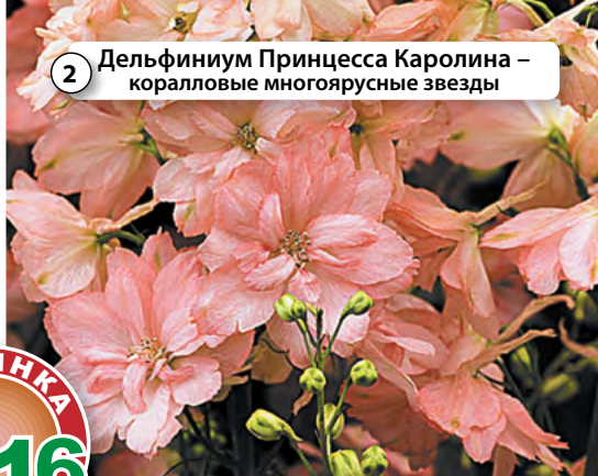
2 Дельфиниум Принцесса Каролина – коралловые многоярусные звезды