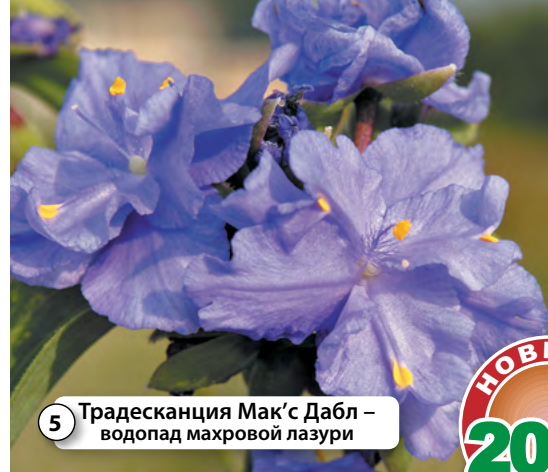
5 Традесканция Мак'с Дабл – водопад махровой лазури