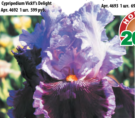
3 Ирис Дэнс Холл Долли – изысканное сочетание цвета и формы

Lilium asiatica Арт. 4123 1 шт. 199 руб.