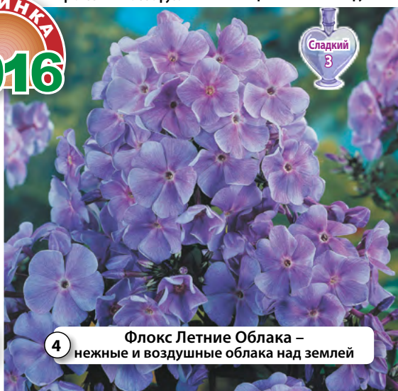
4 Флокс Летние Облака – нежные и воздушные облака над землей