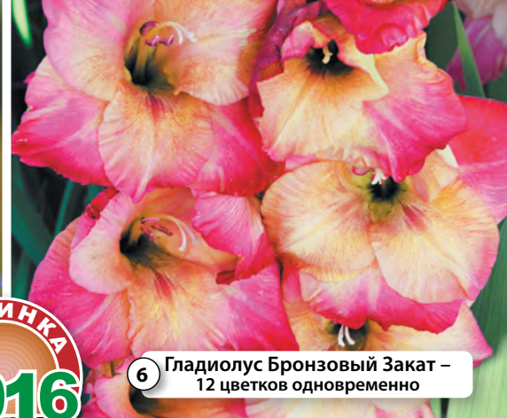
6 Гладиолус Бронзовый Закат – 12 цветков одновременно