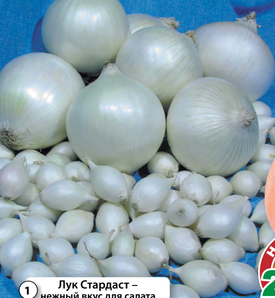
1 Лук Стардаст – нежный вкус для салата