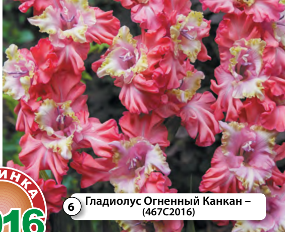
6 Гладиолус Огненный Канкан – (467C2016)