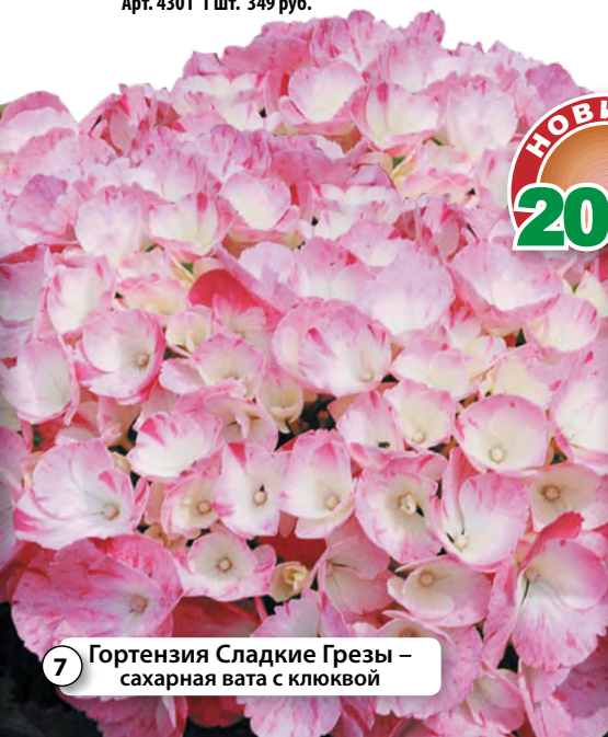
7 Гортензия Сладкие Грезы – сахарная вата с клюквой