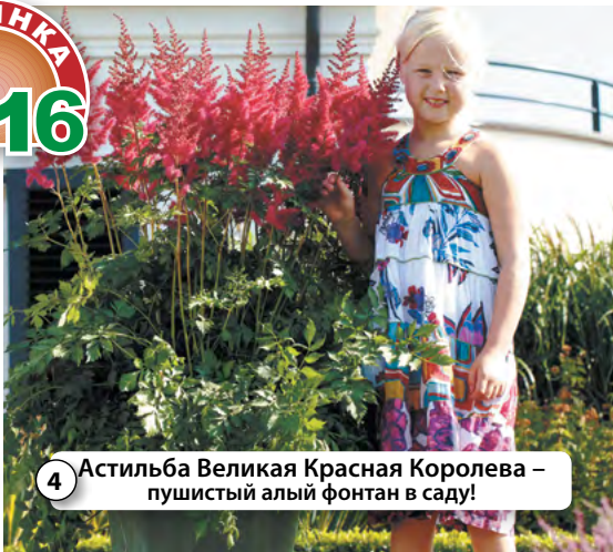
4 Астильба Великая Красная Королева – пушистый алый фонтан в саду!