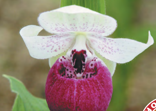
1 Венерин башмачок Викис Дилайт – летняя садовая орхидея