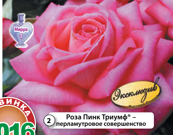
2 Роза Пинк Триумф® – перламутровое совершенство