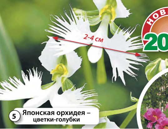
5 Японская орхидея – цветки-голубки