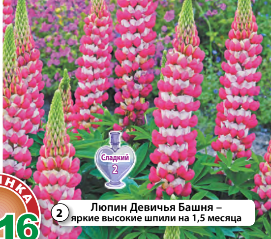
2 Люпин Девичья Башня – яркие высокие шпильки на 1,5 месяца