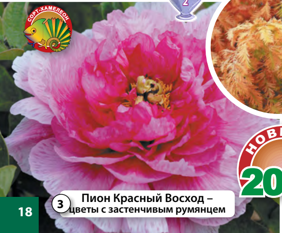
3 Пион Красный Восход – цветы с застенчивым румянцем