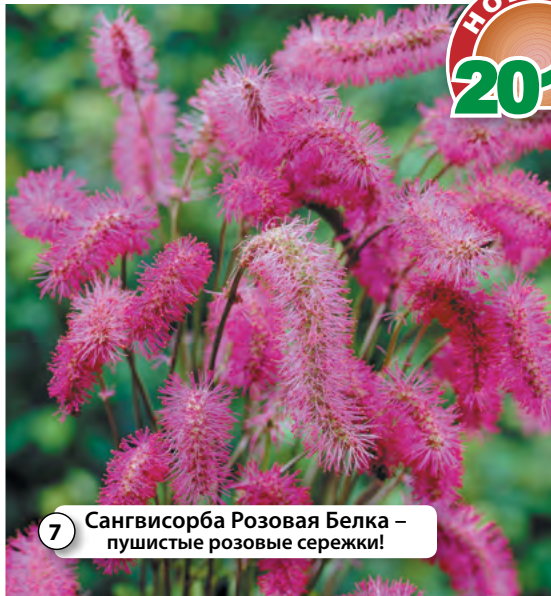
7 Сангвисорба Розовая Белка – пушистые розовые сережки!