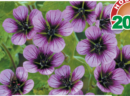
7 Герань Саломея – полог из цветов, обильное и долгое цветение