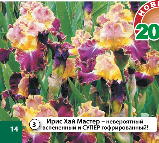
3 Ирис Хай Мастер – невероятный вспененный и СУПЕР гофрированный!