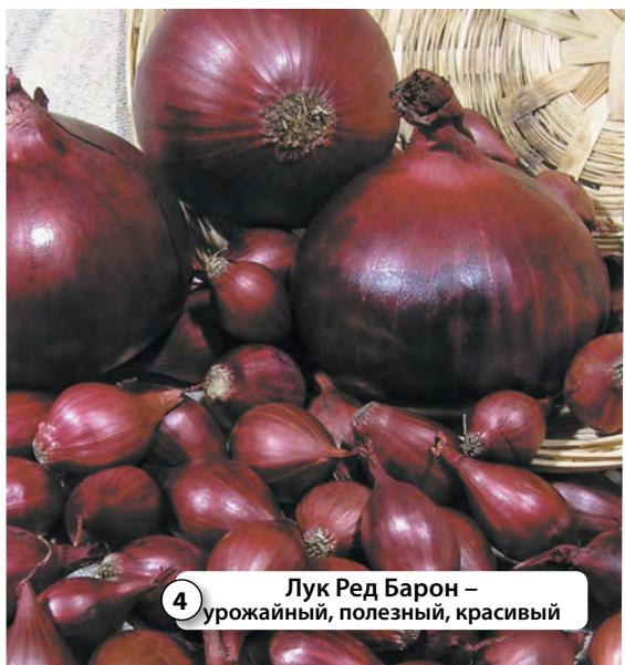
4 Лук Ред Барон – урожайный, полезный, красивый