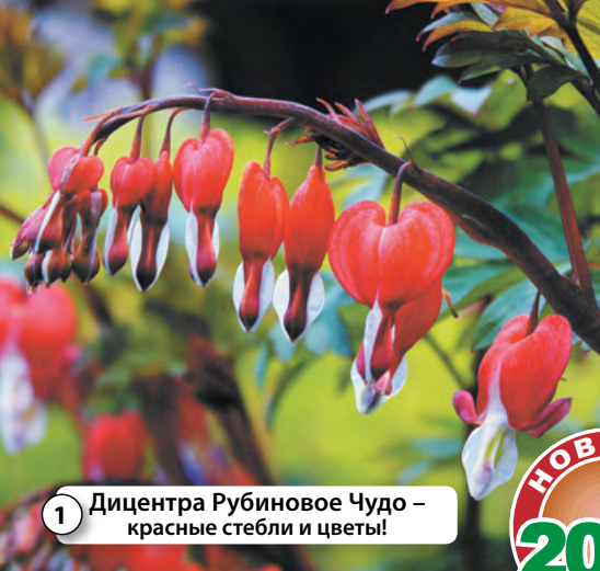
1 Дицентра Рубиновое Чудо – красные стебли и цветы!