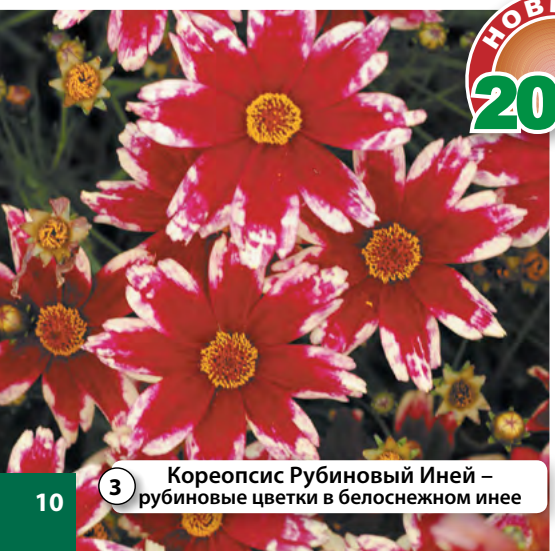
3 Кореопсис Рубиновый Иней – рубиновые цветки в белоснежном инее