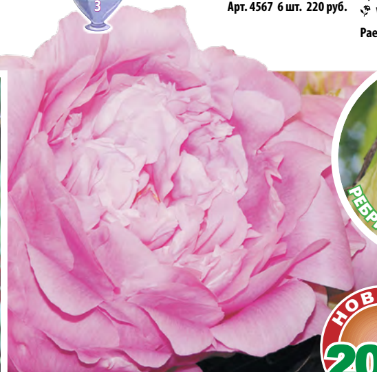
7 Пион Розовый Зефир – плотные розовидные цветки