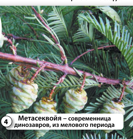
4 Метасеквойя – современница динозавров, из мелового периода