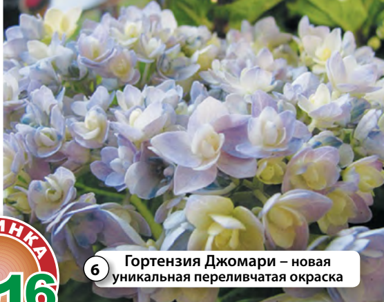
6 Гортензия Джомари – новая уникальная переливчатая окраска