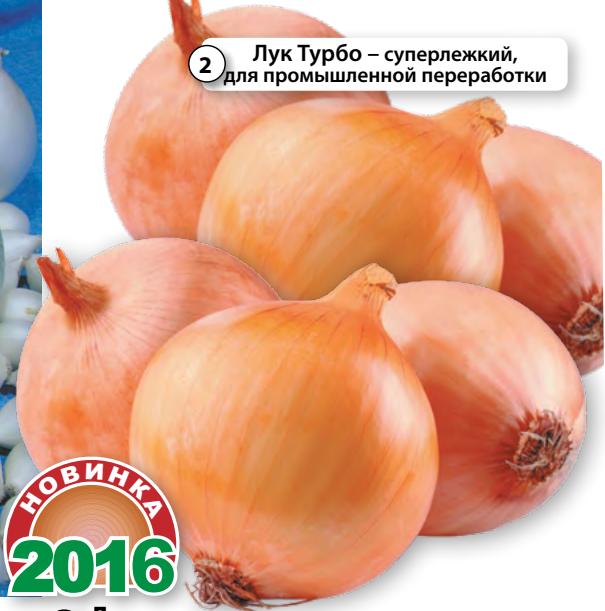
2 Лук Турбо – суперлежкий, для промышленной переработки